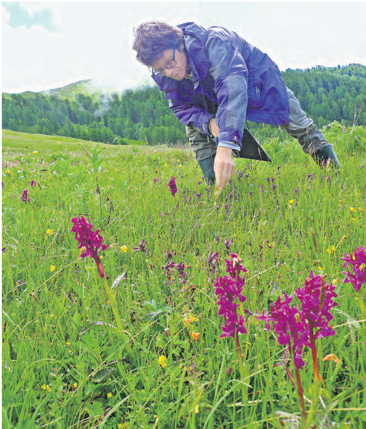
Die Wiesenmeisterschaft 2015 ist fast abgeschlossen, morgen findet in Tschlin ein Fest statt.

Es empfiehlt sich entweder einen Pflanzenführer in Buchform oder einen Experten oder eine Expertin mitzunehmen, respektive sich für eine Exkursion anzumelden, welche Engadin Scuol Samnaun Tourismus anbietet. Ein Fotoapparat ist auch nie